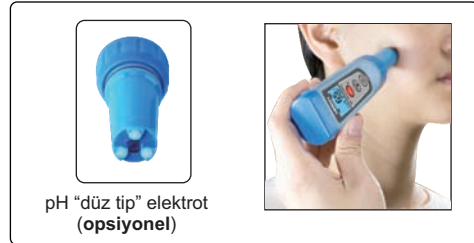
pH "düz tip" elektrot (opsiyonel)