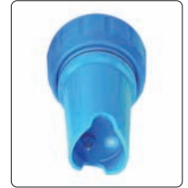
ORP "platin iğne" elektrot (opsiyonel)