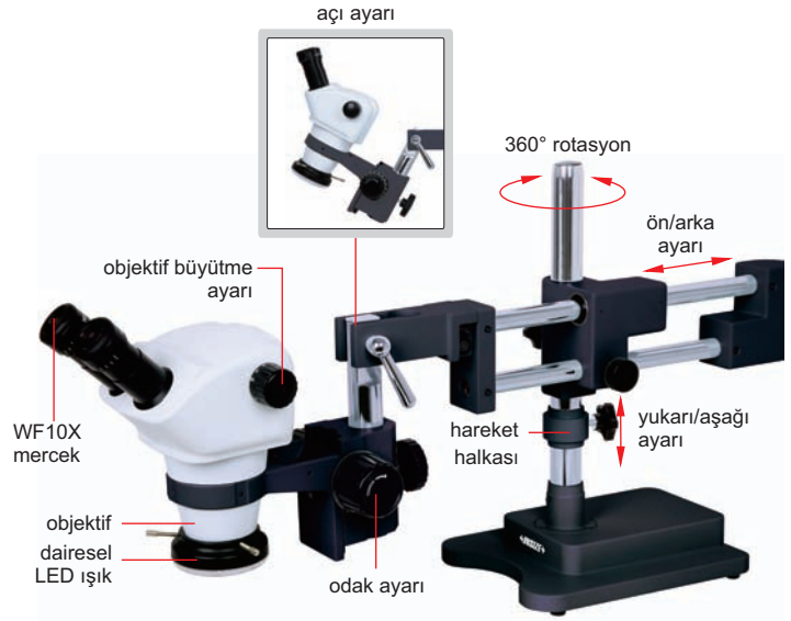
5106-M50 (tip B stand ile)