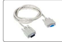
RS232 kablo (opsiyonel)