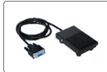
ayak pedali (opsiyonel)