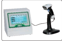
tarama tabancası giriş ürünü kod işlevi (özelleştirilmiş)