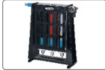
hava filtresi (opsiyonel)