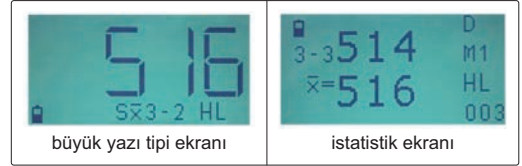
büyük yazı tipi ekranı