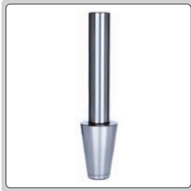
standart çubuk (dahil)