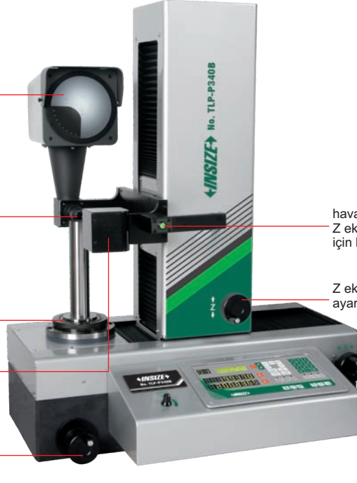
havalı destek düğmesi, X ve Z eksenlerinin hızlı hareketi için kullanılır