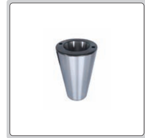
BT50/BT30 dönüştürücü (opsiyonel)